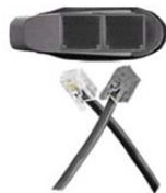
錯誤接線但正常工作